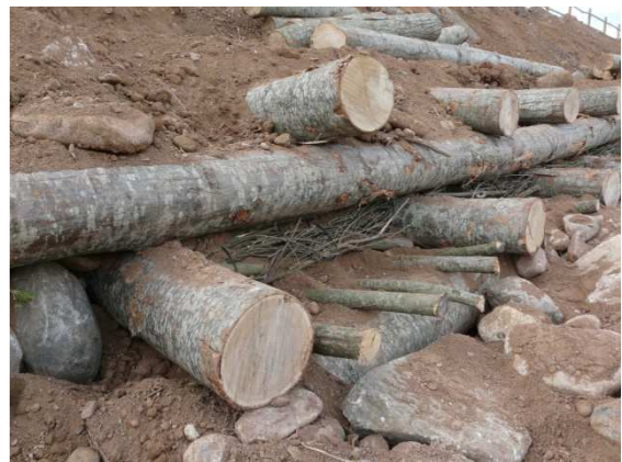
Estaves en un entramat

El fet que rebrotin el primer any no evidencia el bon estat de l'estaca ja que pot estar utilitzant les reserves emmagatzemades.