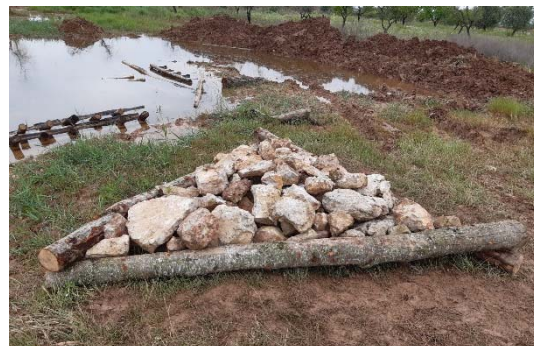
Estructura de biodiversificació amb pedra

El reblert es pot variar, essent el més habitual una acumulació de brancada de la pròpia zona o bé una acumulació de pedres de 20-30 cm de diàmetre que creen cavitats.