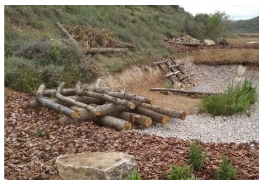
Aplicació d'estructures de biodiversificació

Es una tècnica senzilla que permet ordenar en el paisatge un tipus de nínxol molt útil per la fauna.