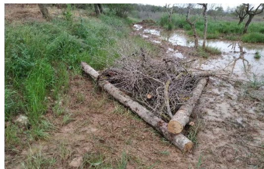
Estructura de biodiversificació amb brancada