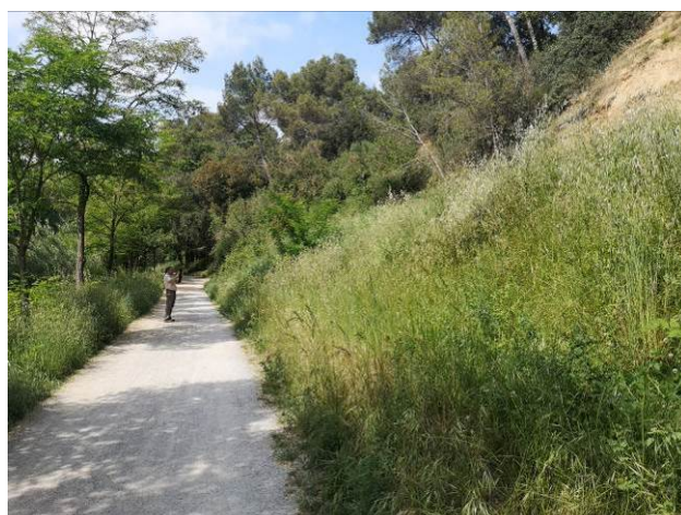
Antes (2016) / Después (2019)

PALABRAS CLAVE: Taludes fluviales, revegetación, estabilización de taludes.