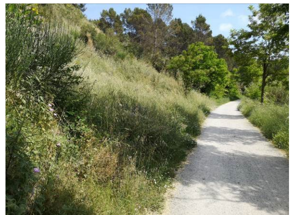
Antes (2016) / Después (2019)