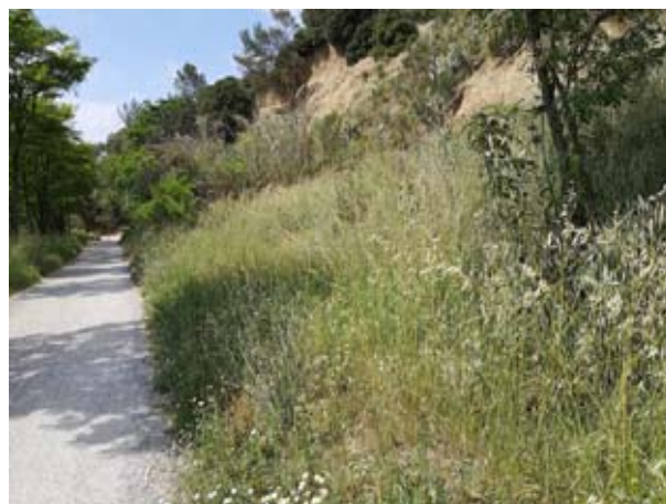
Antes (2016) / Después (2019)