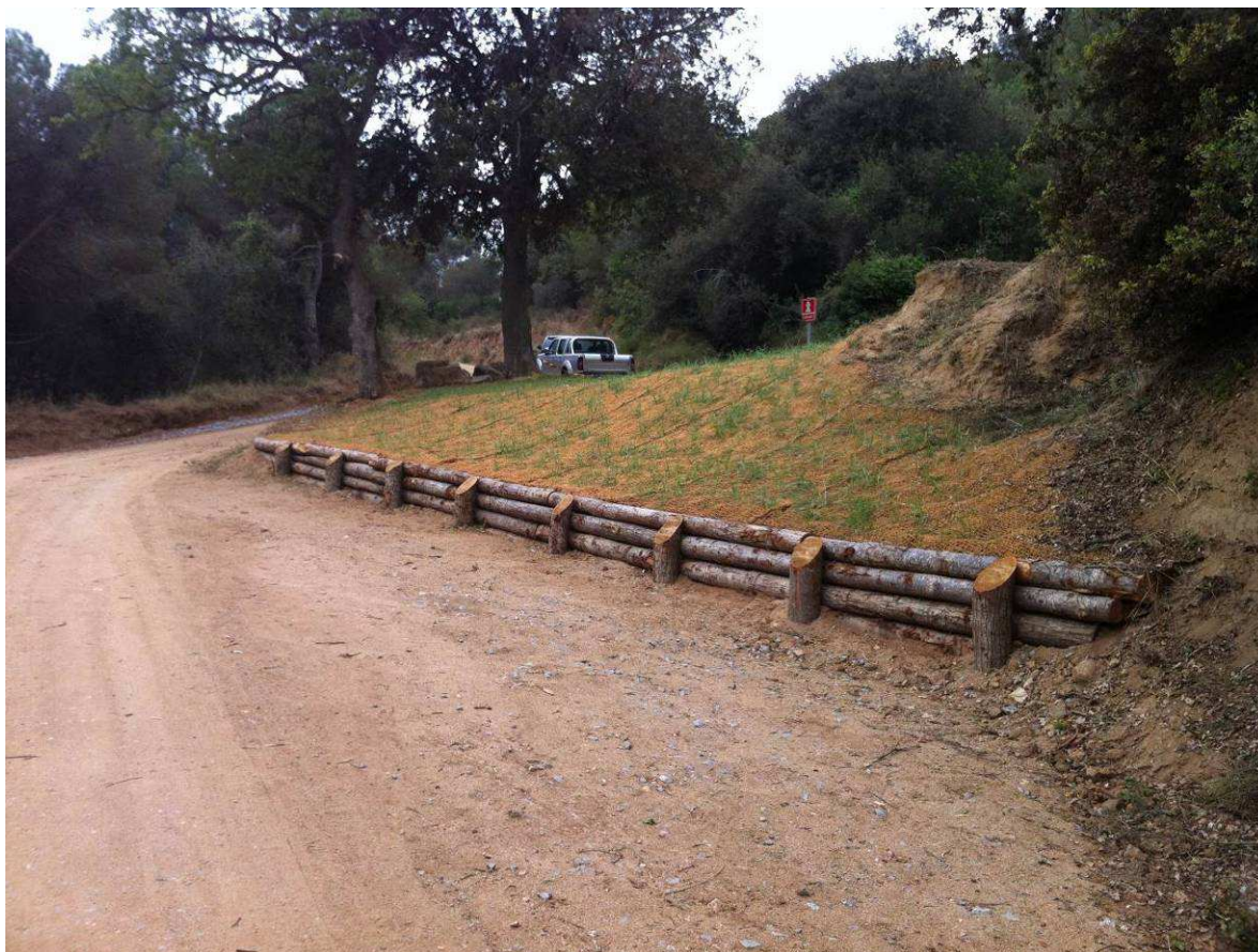
Resultado final de la actuación

PALABRAS CLAVE: Eliminación camino, protección de taludes, acceso vehículos de bomberos