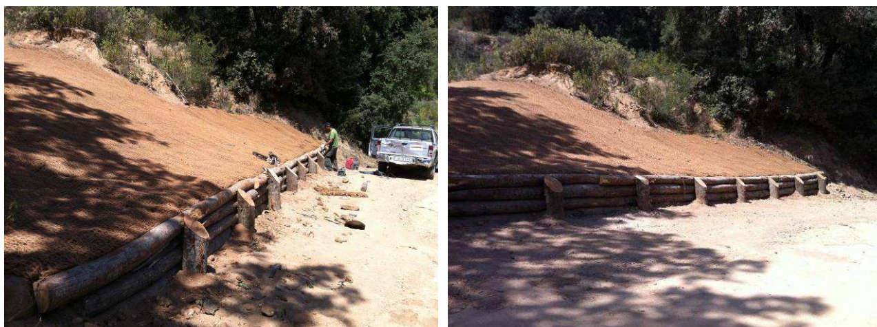
Trabajos de acabados con la protección del talud con red de coco