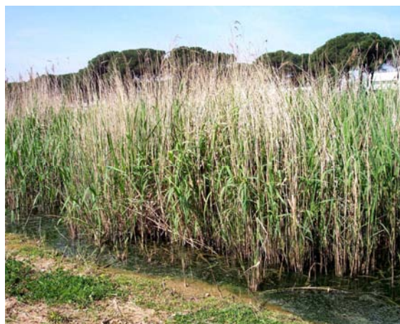
Imagen general del carrizo