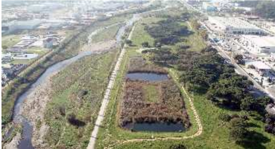
Toni Cantos – 2005 (web Museo de Granollers)

El sistema de depuración del terciario de Can Cabanyes se basa en un sistema con una laguna inicial que recibe el agua de más de un metro de profundidad, unos humedales con el agua a 40cm con una isla en el centro para fomentar la biodiversidad, una segunda laguna, donde hoy se sitúa el observatorio de aves, una segunda zona de humedal y una tercera zona de aguas abiertas de donde el agua vuelve al río o se utiliza para riego.