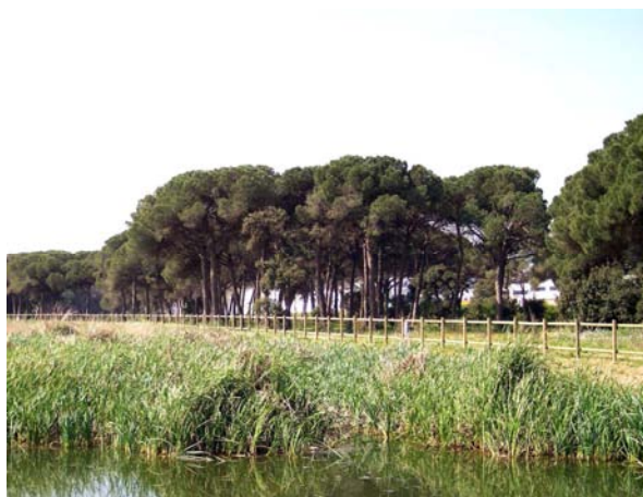
Imatge general la enea