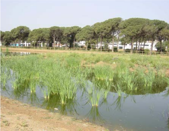
Imagen general de la plantación

Con este motivo se pretende crear también una área de interés natural para la educación ambiental y la divulgación.