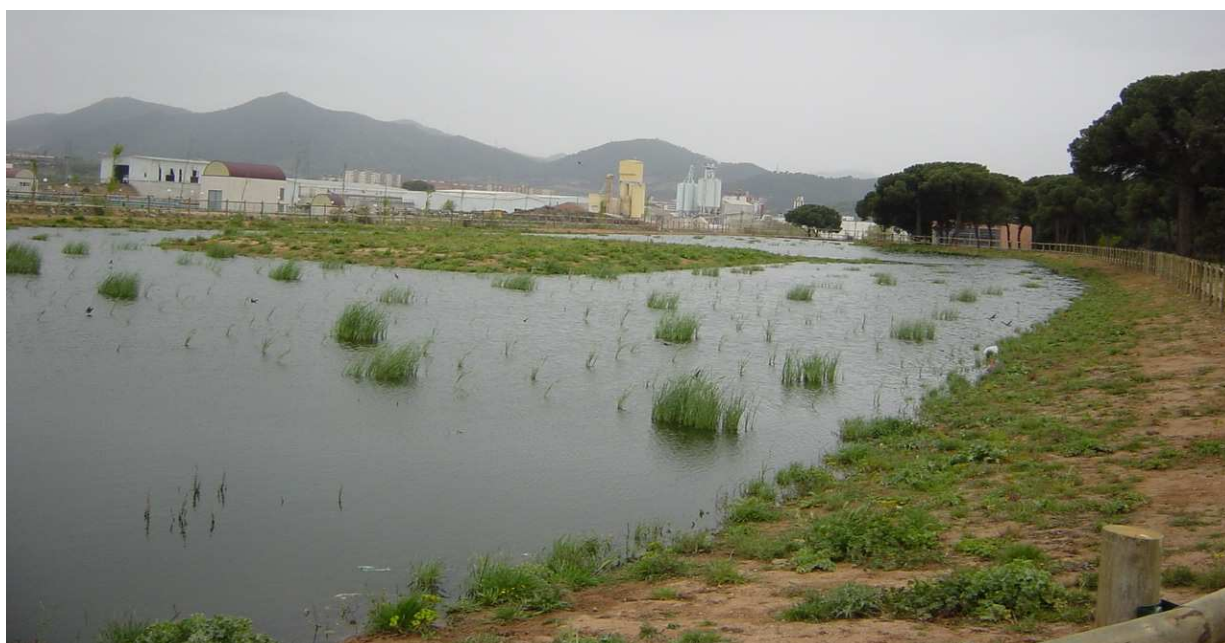
En poco tiempo los nuevos tallos ya empezaron a aparecer