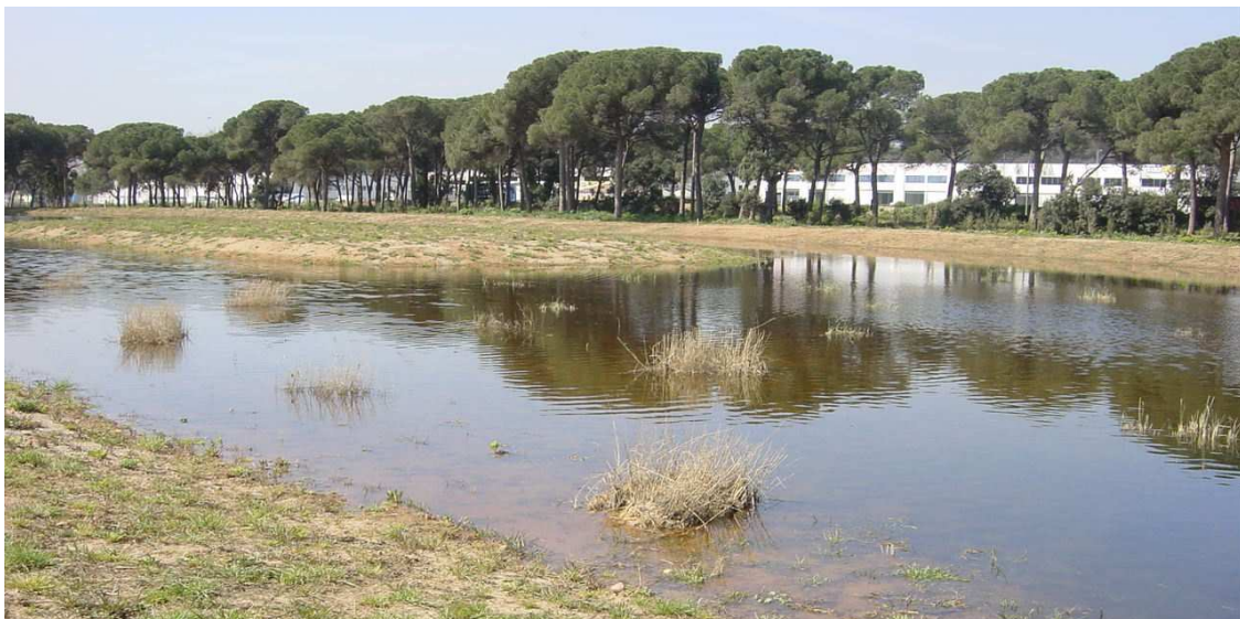
Herbazales recién instalados que debido al periodo que fueron introducidos no presentaban aún hojas verdes.

El sistema radicular de las plantas en estos materiales es funcional desde el primer momento, lo que permite obtener mejores resultados desde el principio en la disminución de la carga orgánica en humedales de depuración natural. La combinación de la enea ( Typha sp. ) y el carrizo ( Phragmites australis ) aumenta los rendimientos en la depuración ya que presentan estrategias sinérgicas.