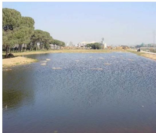
Justo después de la ejecución