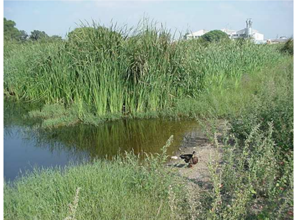
Los humedales son utilizados por los pájaros como hábitat