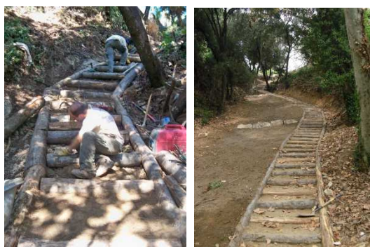
Colocación de los diferentes troncos con barras corrugadas