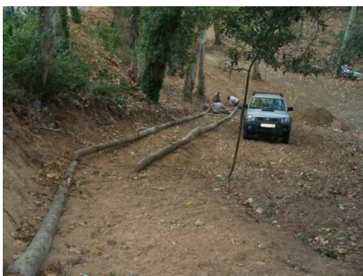
Presentación de los troncos longitudinales