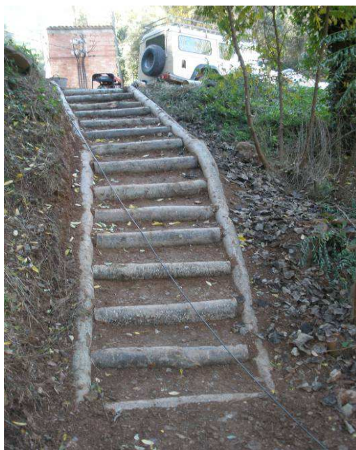
Ejemplo de escaleras de madera de castaño sin pelar

De manera longitudinal se disponen troncos que delimitan la zona de escalones. De esta forma se hace una estructura monolítica y por lo tanto el conjunto es mucho más resistente. En función de la pendiente y la peligrosidad de paso se puede complementar con barandillas, también de madera de castaño.