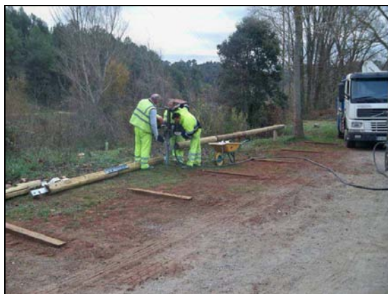
Operarios instalando la valla

Delimitación de 37 plazas existentes con ecotraviesas. Creación de 18 nuevas plazas de aparcamiento. Instalación de 70m.l. de valla de madera para delimitar los espacios.