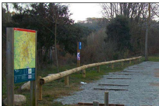
Nuevas zonas de aparcamiento

CONCEPTOS CLAVE: Ecotraviesas, instalación valla modelo Vall d'Horta.