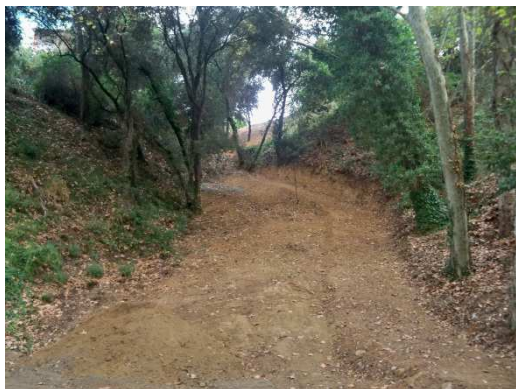
Preparació del terreny