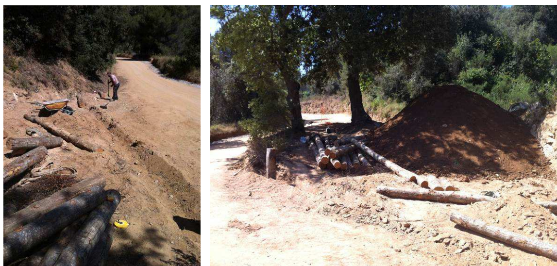
Treballs d'aport de terres i creació de la base de la palissada