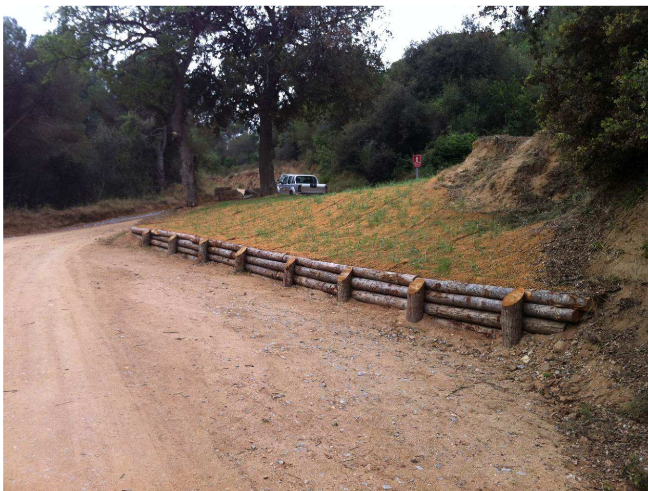
Resultat final de l'actuació

PARAULES CLAU: Eliminació camí, protecció de talussos, accés vehicles de bombers