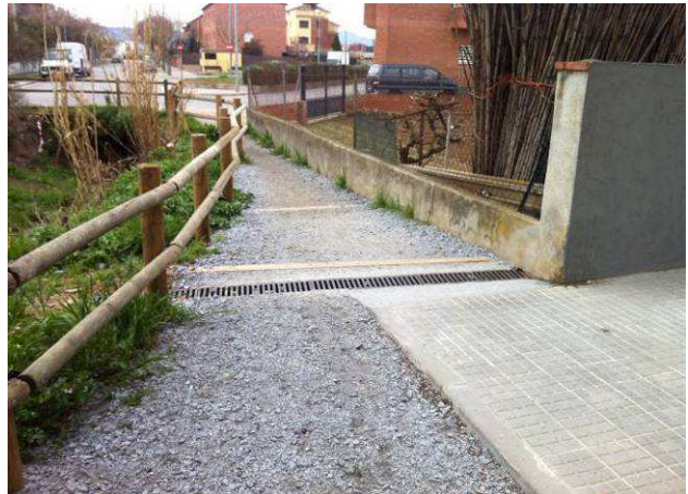
Imatges de l'abans i després de l'actuació