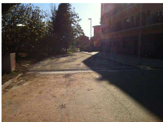
Imatges del procés d'execució de les obres.

PARAULES CLAU: gestió de l'escorrentiu, millora del ferm, gestió de l'aigua.