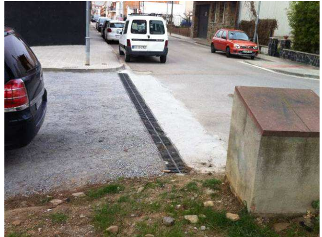
Imatges de l'abans i després de l'actuació