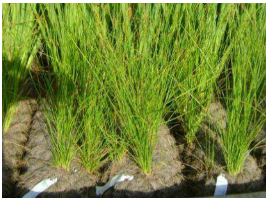
Rolls vegetatitzats al viver