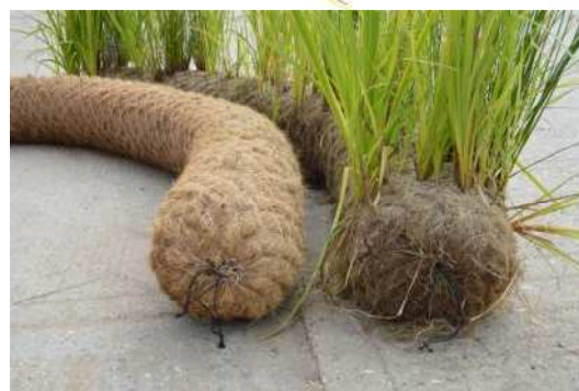
Rolls sense vegetar i vegetaltitzats